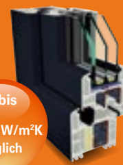
S 8000 IQ mit 74 mm Bautiefe

U_f bis 0,89 \text{W/m}^2\text{K} möglich