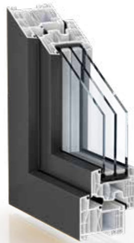
FOLIERT IN UNIFARBEN