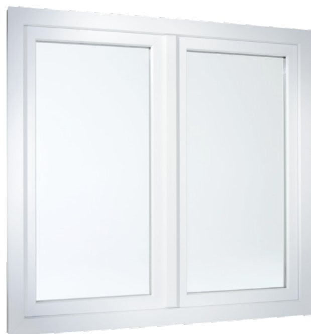
2-flügeliges Fenster in flächenversetzter Variante

Und auch die Technik im Inneren überzeugt: Die Mehrkammerprofile nutzen die isolierende Eigenschaft von Luft und erfüllen so höchste Anforderungen an die Wärmedämmung. Das sorgt nicht nur für angenehmes Raumklima bei jedem Wetter, sondern hilft auch im Winter, die Heizkosten spürbar zu senken.