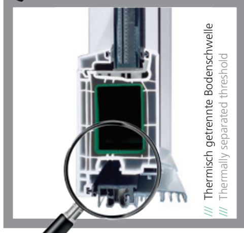
/// Thermisch getrennte Bodenschwelle /// Thermally separated threshold