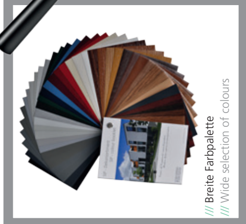
/// Breite Farbpalette /// Wide selection of colours