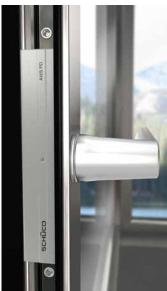
Panorama Design Einsteckgetriebe Panorama Design push-in gearbox