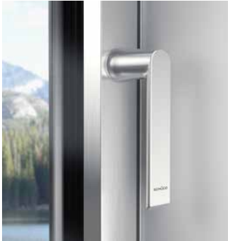
Rosettenloses Griffdesign Handle design without rosettes

Eigens für das neue Aluminium-Fenstersystem AWS 75 PD.SI wurde das neue rosettenlose Schüco Griffdesign entwickelt, um die besonders schlanken Flügelprofile ideal zur Geltung zu bringen.