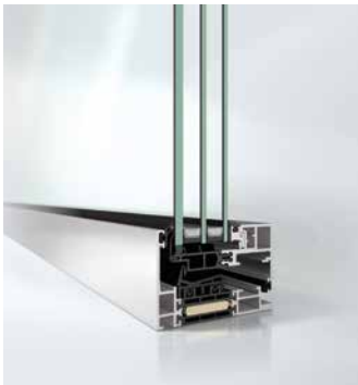
Schüco AWS 75 PD.SI Öffnungselement Schüco AWS 75 PD.SI opening unit