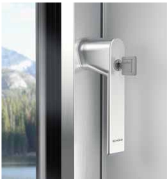
Rosettenloses Griffdesign, abschließbar Lockable handle design without rosettes

Burglar resistance class RC 2 can be achieved with the window system AWS 75 PD.SI.