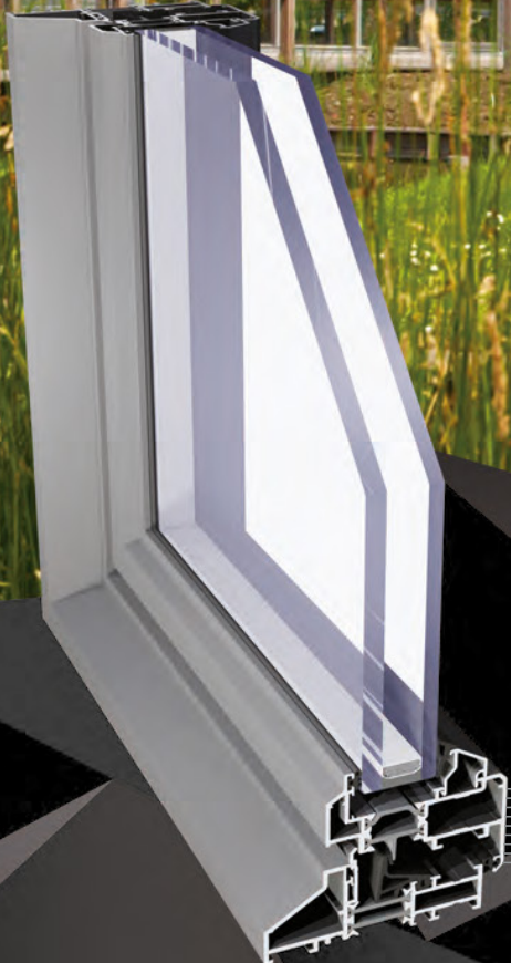
Fenster Steel Look