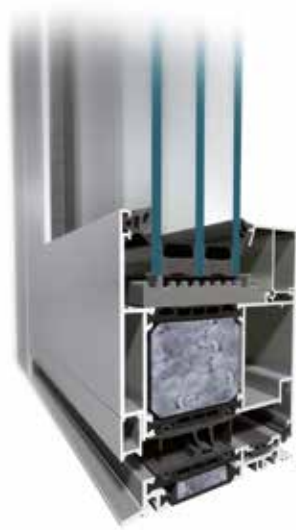
MB-104 Passive SI