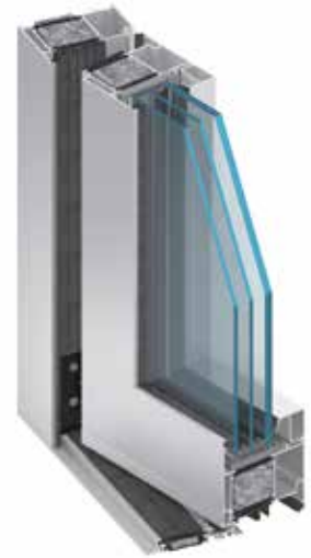
MB-104 Passive SI, RC3

Beispiele für den Wärmedurchgangskoeffizienten U_D