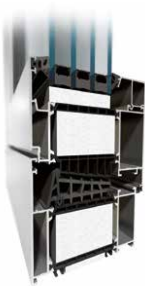
MB-104 Passive Aero