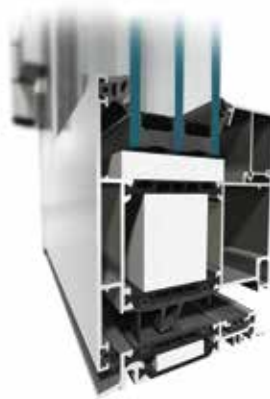
MB-104 Passive Aero