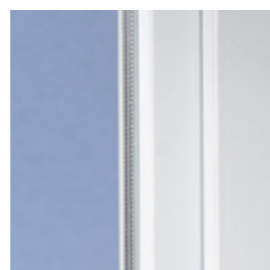
Klassisches Design mit weicher Kontur

Mit modernen Kunststofffenstern aus VEKA Profilen gewinnt jedes Haus. Denn das klassische Design des SOFTLINE Systems mit der leicht abgerundeten Kontur ist zeitlos und harmonisiert hervorragend mit unterschiedlichsten Architekturstilen – ob modern oder traditionell, ob Neubau oder Renovierung.